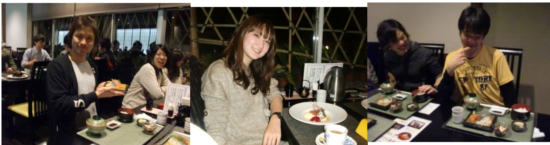
おしゃれな夕食に、ちょっとおすまし。しかし夕食を終えると「発表会」の準備に各自そわそわ